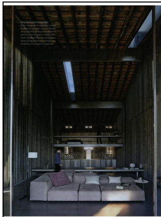
Arquitectura y Diseno (E)