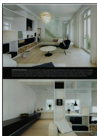
Nuevo Estilo (E)