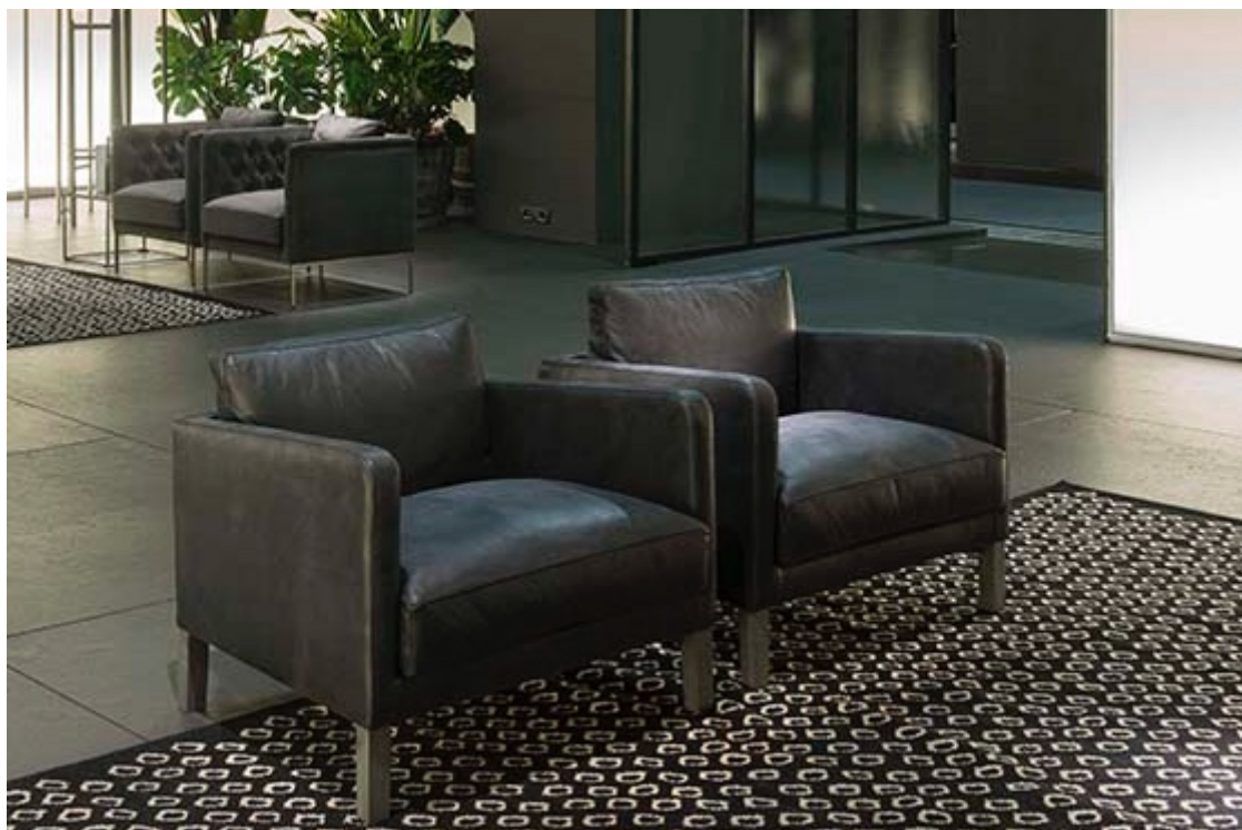
Divano e nuove poltrone Dumas design Piero Lissoni

Introduce nel raffinato mondo Living Divani un primo ambiente centrale dove dominano le linee d'ispirazione borghese del divano Dumas di Piero Lissoni che ripropone, rinnovata, una forma che nella memoria rappresenta il comfort per eccellenza dato da forme imbottite generose e vivibili. Presentato al Salone del Mobile 2016, è ora proposto nella nuova versione poltrona anch'essa caratterizzata da una seduta leggermente sporgente, sostenuta da piedini in legno scuro o metallo brunito che invita a fermarsi e godere della sua morbidezza. Lo schienale basso da cui emerge un morbido cuscino, si raccorda al bracciolo dolcemente curvato, all'insegna dell'assoluta semplicità, che definisce la cifra progettuale del designer e dell'azienda.