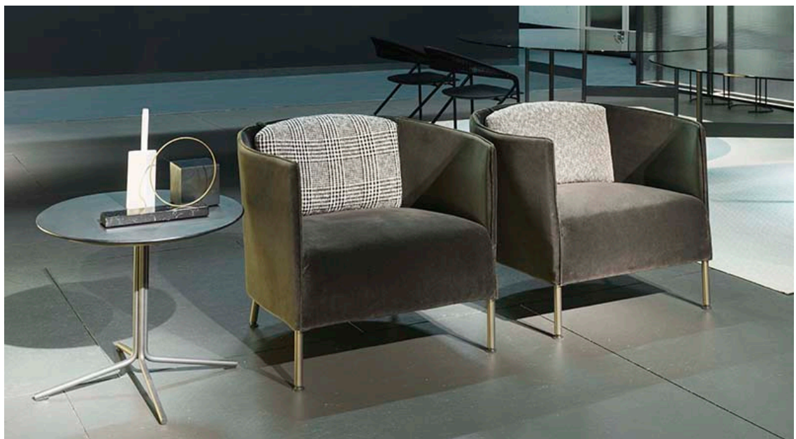
Poltroncine Sartor C. design Piero Lissoni

Alle spalle della libreria Aero di Shibuleru , un secondo ambiente living si apre con un'ampia composizione Extrasoft di Piero Lissoni , divano modulare icona del brand composto da sedute accoglienti e ospitali ognuna rivestita da un differente tessuto nei toni del bianco e del nero, delineandone le forme in un accattivante gioco grafico.