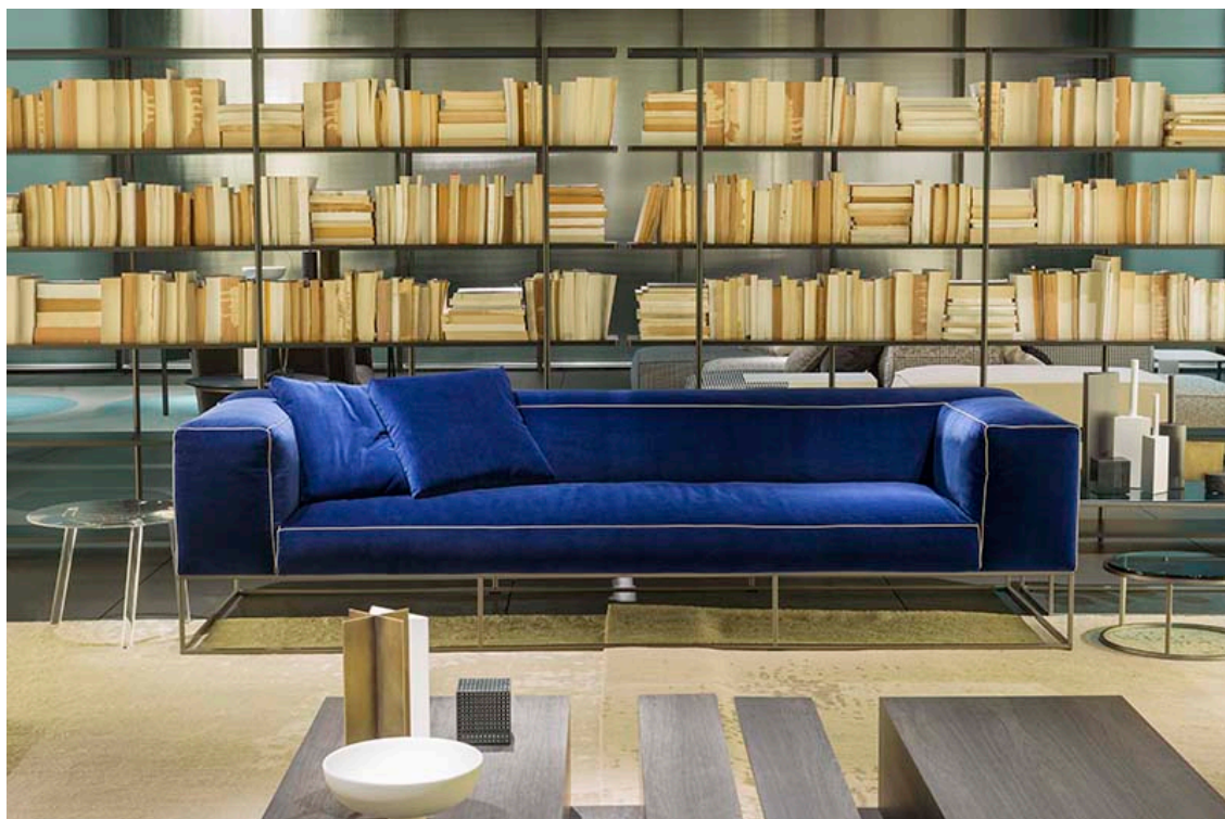
Divano Ile Club design Piero Lissoni, tavolino Grek di Gabriele e Oscar Buratti, libreria Aero design Shibuleru

Rivestite da un elegante velluto blu con profili a contrasto, le forme piene e soffici del divano Ile Club di Piero Lissoni si ergono su una robusta struttura. Di fronte, come una scultura, il tavolino Grek dei fratelli Gabriele e Oscar Buratti , dallo sguardo maschile e dall'estetica fortemente industriale, crea un imponente piano d'appoggio solcato da una fessura centrale che può fungere da portariviste o contenitore per oggetti.