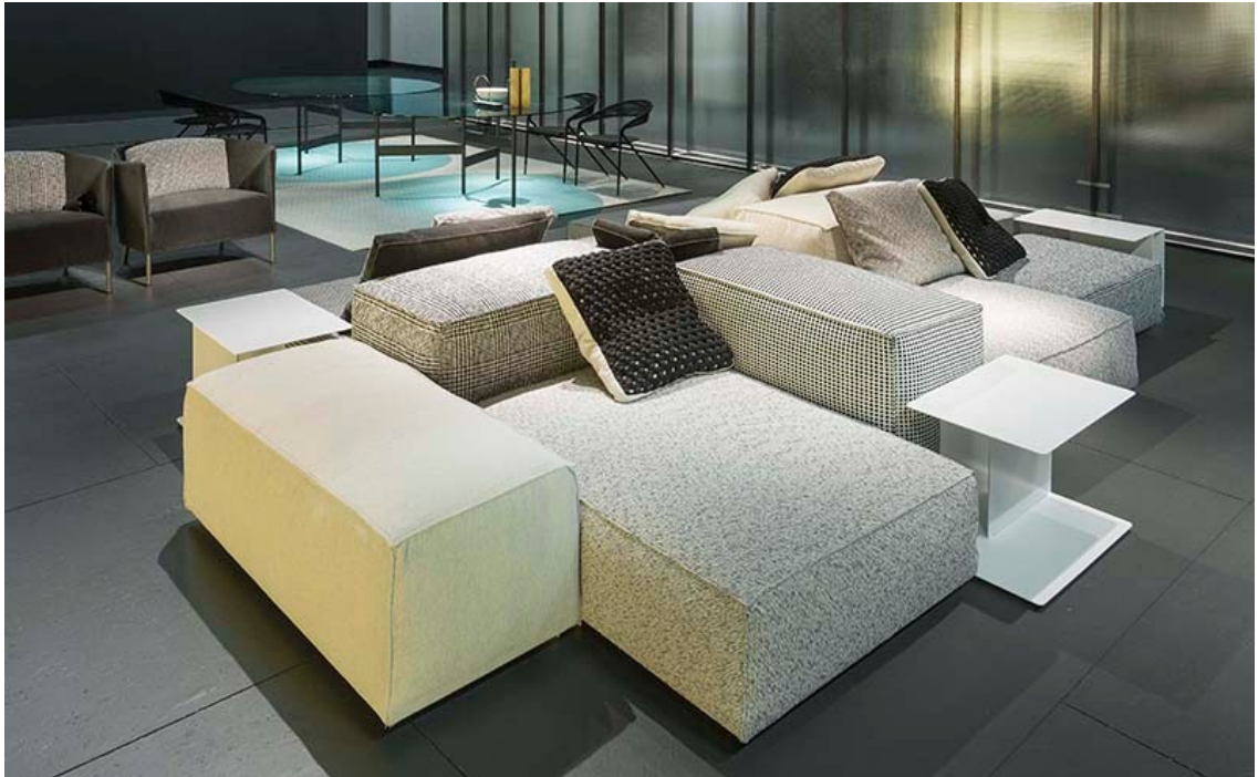
Divano Extrasoft design Piero Lissoni

Alle spalle della libreria Aero di Shibuleru , un secondo ambiente living si apre con un'ampia composizione Extrasoft di Piero Lissoni , divano modulare icona del brand composto da sedute accoglienti e ospitali ognuna rivestita da un differente tessuto nei toni del bianco e del nero, delineandone le forme in un accattivante gioco grafico.