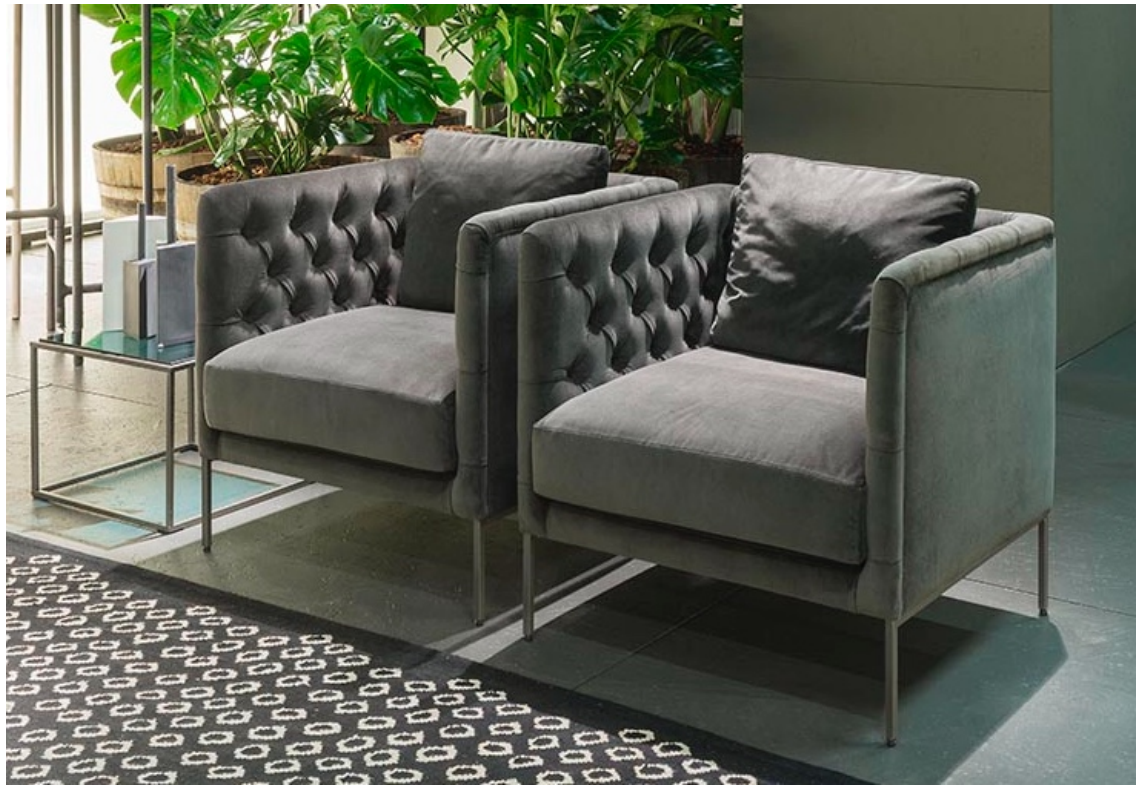
Poltrone Lipp design Piero Lissoni

Rinnovate nelle proporzioni che ne risaltano la bellezza e il comfort, le poltrone Lipp di Piero Lissoni con pregiata lavorazione capitonné reinterpretata secondo lo spirito geometrico contemporaneo tipico del marchio, invitano ad accomodarsi e perdersi in un prezioso rifugio. Scelti in abbinamento i tavolini Ile con piano in vetro blu .