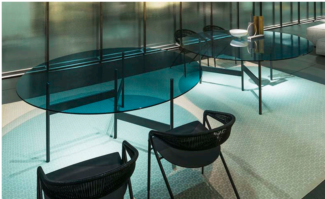
Tavoli Notes design Massimo Mariani con sedie George's design David Lopez Quincoces

Nella nuova variante in prezioso velluto nero le poltroncine Sartor.C , con bracciolo e schienale "destrutturato" sono accompagnate dai tavolini Jelly entrambi a firma di Piero Lissoni .