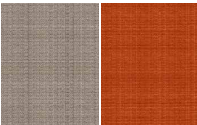
Kirisame Negativo Sepia

Tappeto 100% in lana filata e cardata a mano, qualità tessuto a mano con tecnica kilim a fessure. Made in Pakistan. Disponibile in 2 varianti colore. Dimensioni: 220x280 cm. Disponibile anche su misura.