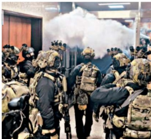
Seul Soldati avanzano verso la sede dell'Assemblea

dal nostro corrispondente Gianluca Modolo