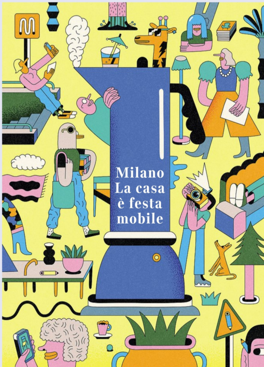
Illustrazione di FABIO BUONOCORE

LA NOVITÀ DELL'ARREDO + PROTAGONISTI + REPORTAGE